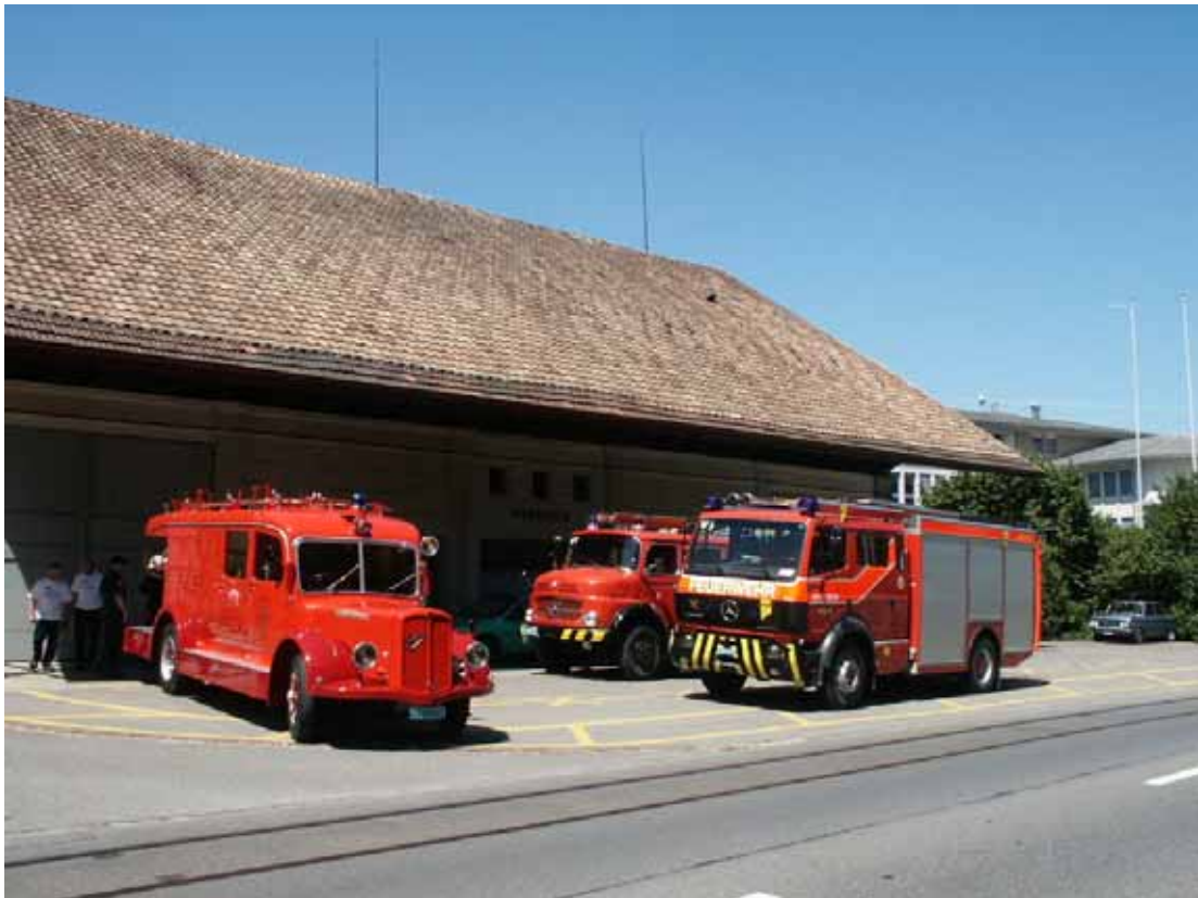
Die « Lise » im vorfertigen Zustand wird von Fahrzeugen der Feuerwehr Menziken zum Jugend- und Dorffest, Fest zur WSB-Eigentrassierung und zur 200 – Jahrfeier des Kantons Aargau abgeholt 21. Juni 2003