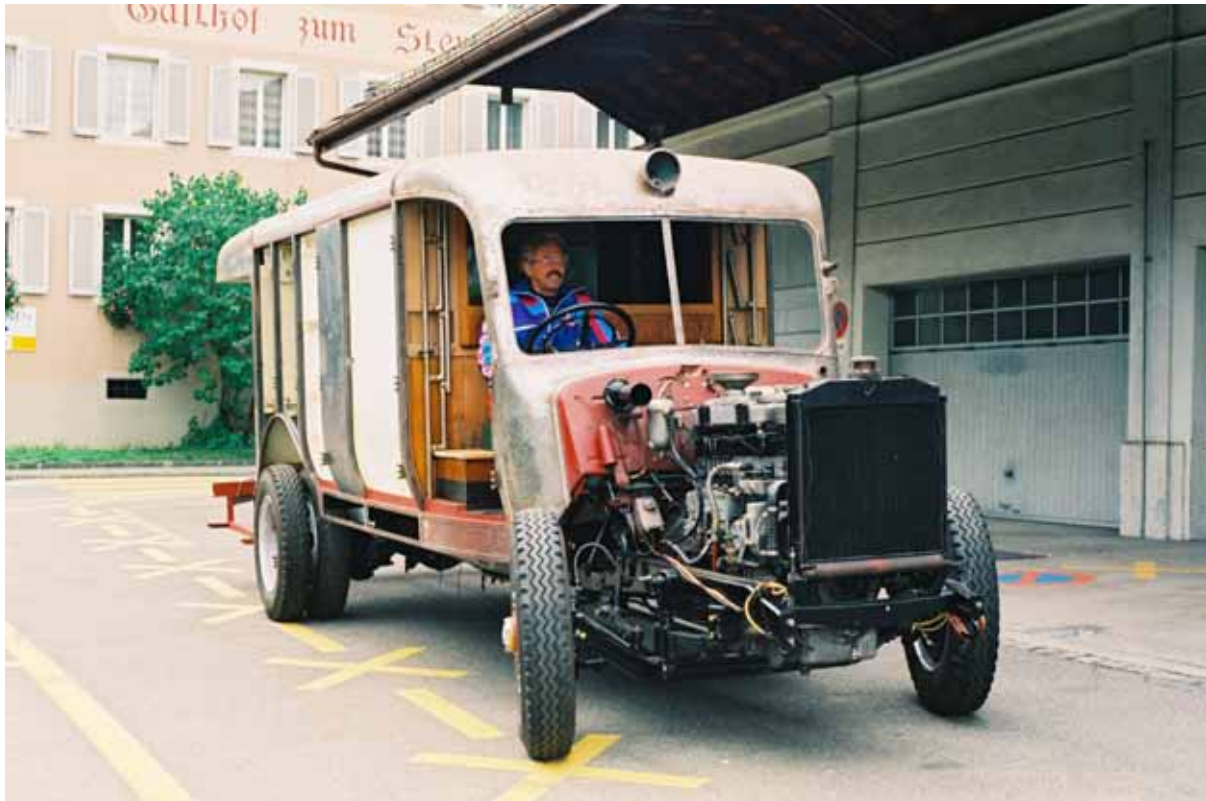
Die « Lise » noch blank vor der Garage